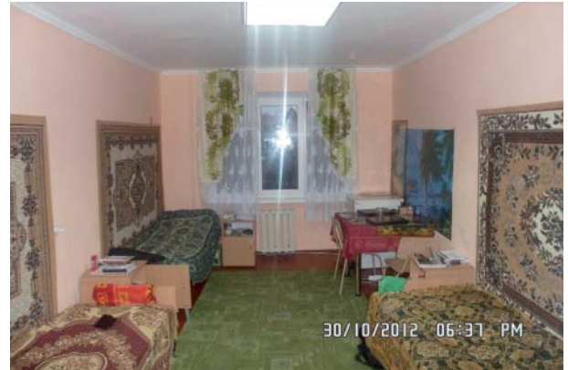
кімната № 55